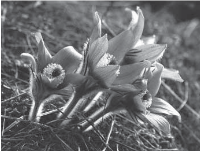
Autorka článku: Anna Dobošová

Takže kochajme sa, fotme, vnímajme atmosféru. Väčšinu tejto krásy môžeme vidieť z turistického chodníka. Preto kráčajme len po ňom, každým krokom mimo neho môžeme ohroziť chránené a vzácne druhy rastlín, o ktorých tu píšeme, ale aj ďalšie, na ktoré nám už nezostalo miesto.