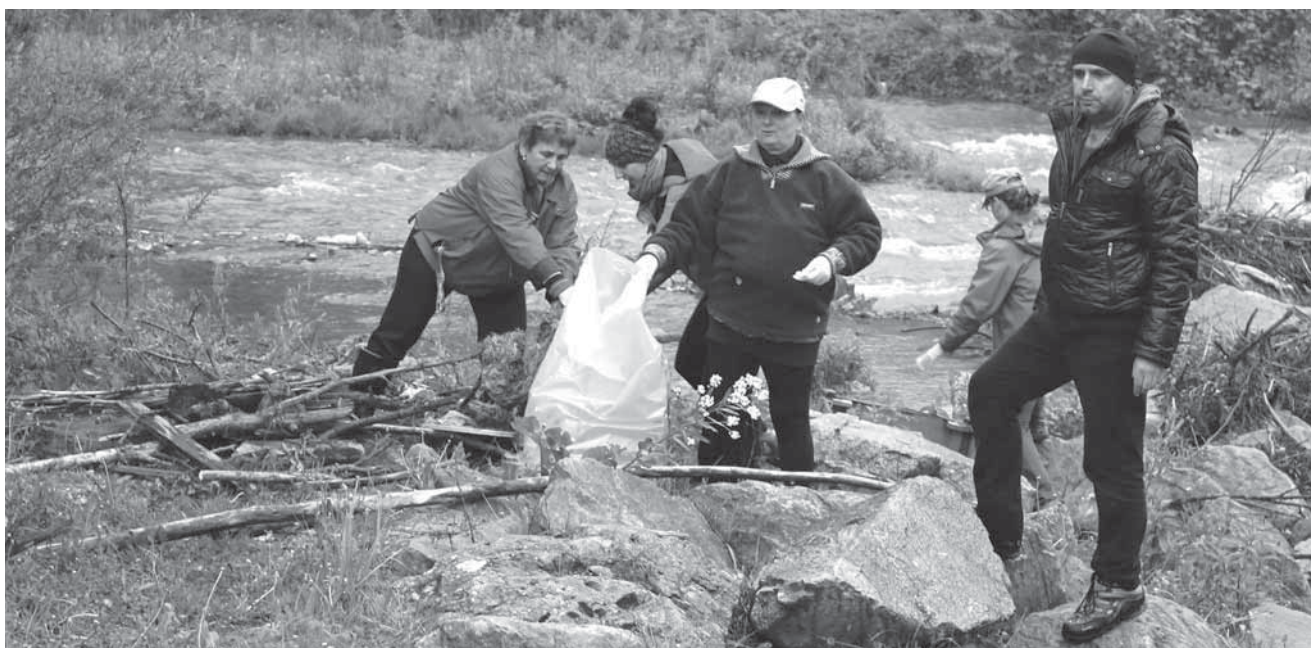
Deň, ktorý sme venovali našej Varínke, stál za to!