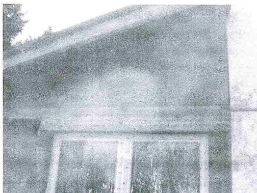
ZS Varín SO5 (2)