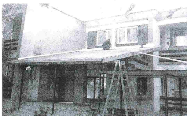
ZS Varín SO5 (146)

- RO pre ROP na svojom zistení naďalej trvá.