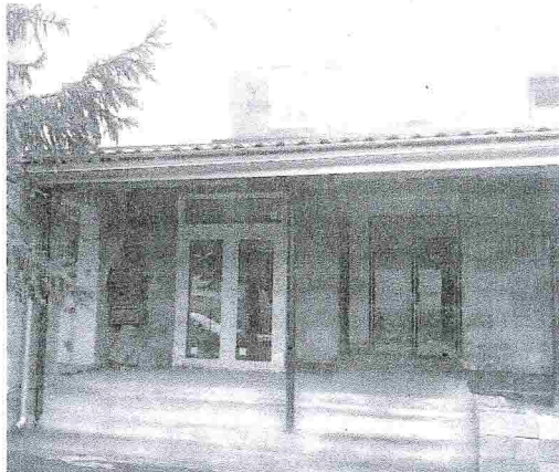
ZS Varín SO5 (18)