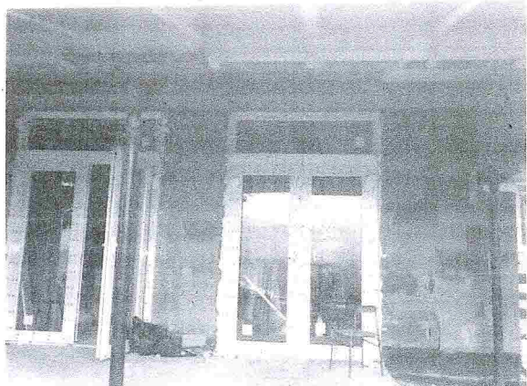
ZS Varín SO5 (156)

- Dodávateľ aj so stavebným dozorom sa odvolávajú na skutočnosť, že strop je realizovaný v súlade s projektovou dokumentáciou. Z priloženej fotodokumentácie je zrejmé, že sa realizoval len železobetónový veniec a železobetónový strop sa v miestnosti č. 1.04 nere realizoval.